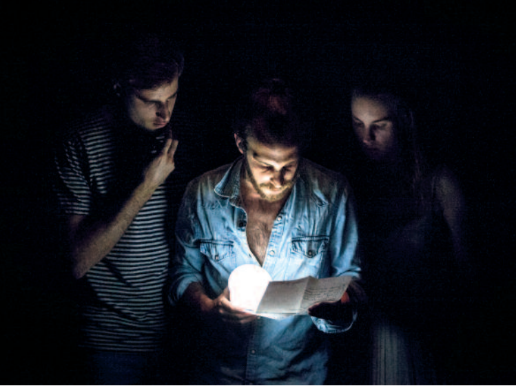
Non c'est pas ça ! [Treplev variation]